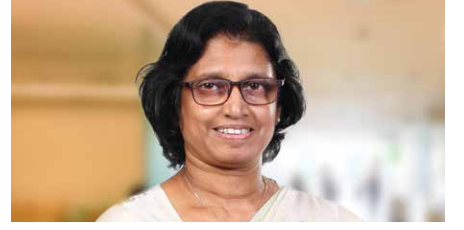
மல்காந்தி வரகாகொட மேலதிகப் பணிப்பாளர், மனித வளங்கள்