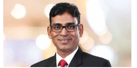
ஷான் குறிஞ்சீதரன் மேலதிகப் பணிப்பாளர், வங்கியல்லா நிதியியல் நிறுவனங்களின் மேற்பார்வை