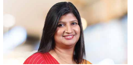
ஶரந்தி லியனகே மேலதிக செயலாளர், செயலகத் திணைக்களம்