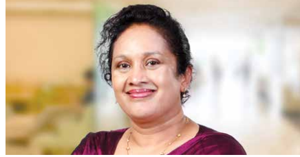
டிலினி விலத்கமுலா மேலதிகப் பணிப்பாளர், சட்டம்