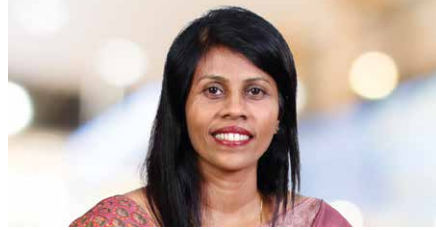
மானில் தமயந்தி மேலதிக கண்காணிப்பாளர், நாணயத் திணைக்களம்