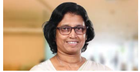
මල්කානි වරකාගොඩ අතිරේක අධ්‍යක්ෂ, මානව සම්පත්