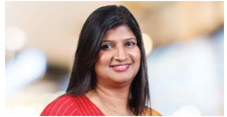
චන්ද්‍රි ලියනගේ අතිරේක ලේකම්, ලේකම් දෙපාර්තමේන්තුව