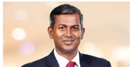
සිසිර ජයසේකර අතිරේක ප්‍රධාන ගණකාධිකාරී