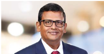
රංකාපති ක්‍රිමරන් අතිරේක අධ්‍යක්ෂ, සාර්ව විචක්ෂණතා අධ්‍යයන