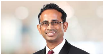
විනුර ගමගේ අතිරේක අධ්‍යක්ෂ, තොරතුරු තාක්ෂණ