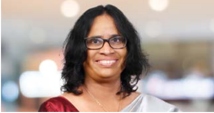
සුජාතා කැරුවල අතිරේක අධ්‍යක්ෂ, බැංකු අධීක්ෂණ

අතිරේක දෙපාර්තමේන්තු ප්‍රධානීන් (2025 දෙසැම්බර් 31 වන දිනට)