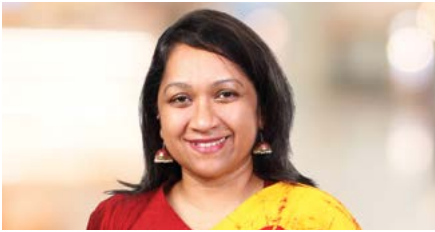
පවිත්‍රි විතානගේ අතිරේක අධ්‍යක්ෂ, නීති