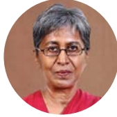
ලුෂ්නි විරකෝන් මණ්ඩල සාමාජික

ආර්ථික විද්‍යාව පිළිබඳ ආචාර්ය උපාධිය, මැන්වෙස්ටර් විශ්ව විද්‍යාලය, එක්සත් රාජධානිය