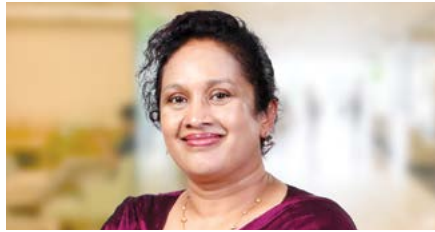
ඩිලිනි විලන්ගමුව අතිරේක අධ්‍යක්ෂ, නීති