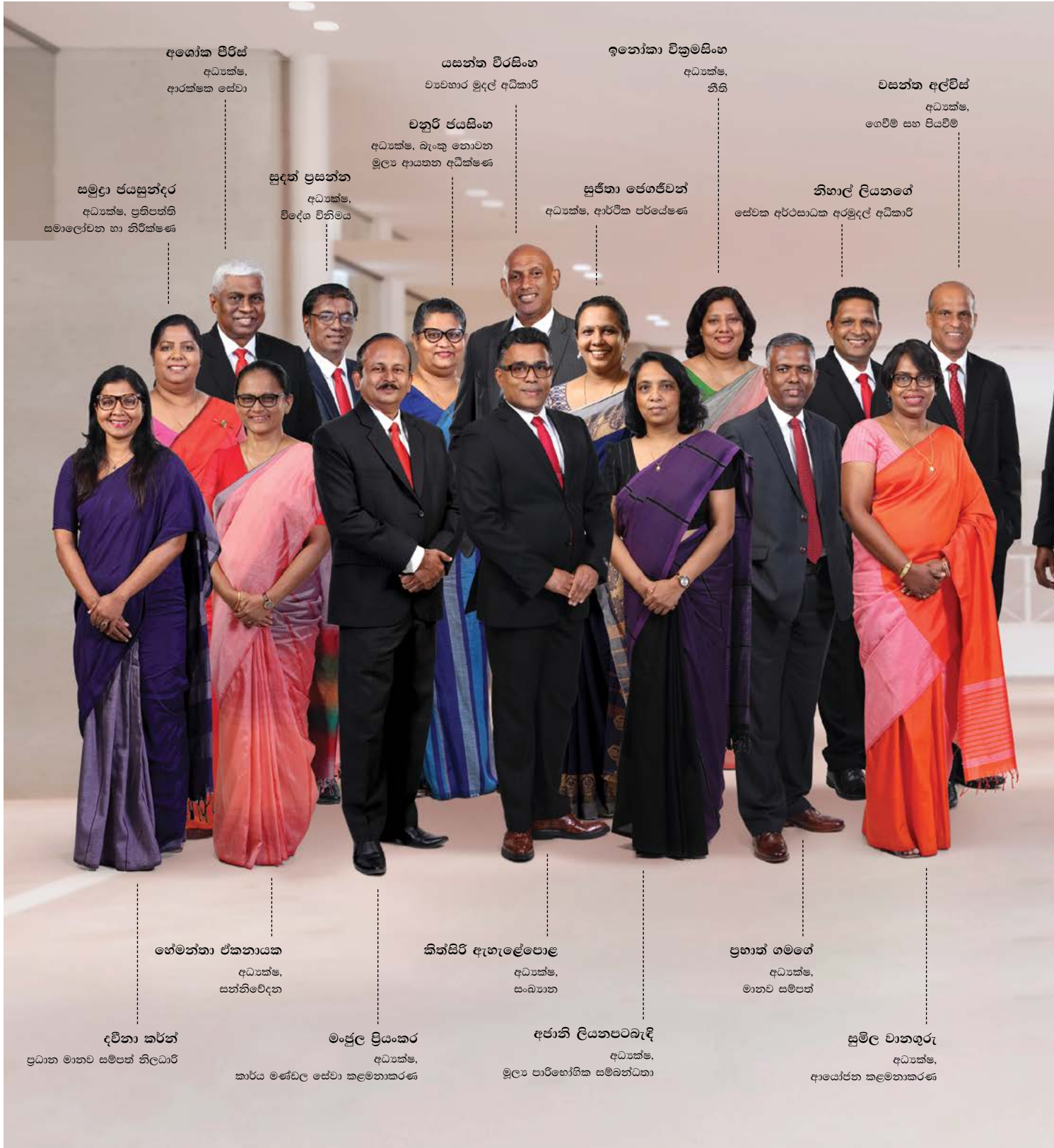
අගේක පිරිස් අධ්‍යක්ෂ, ආරක්ෂක සේවා

දෙපාර්තමේන්තු ප්‍රධානීන් (2025 දෙසැම්බර් 31 වන දිනට)