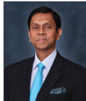
අජිත් නිවාඩි කබිරාල් මහතා 2006 - 2015