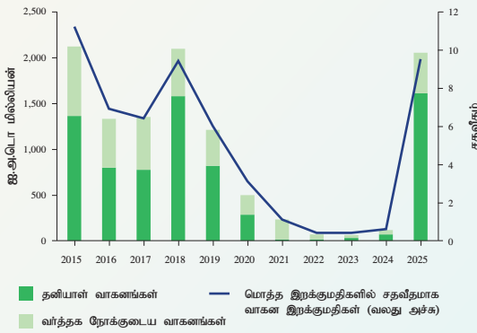
வருடாந்த வாகன இறக்குமதிகள்

மூலங்கள்: இலங்கைக் கங்கம் இலங்கை மத்திய வங்கி