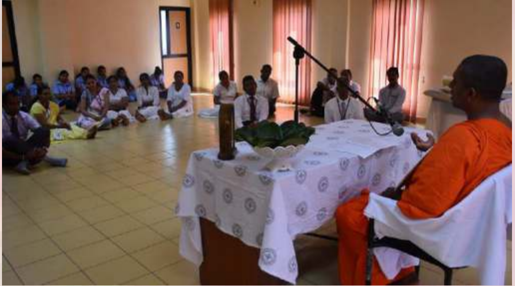
දිනය - 2018 මාර්තු මස 28 වන දින ප.ව. 12.30 සිට ප.ව 01.30 දක්වා

ධර්ම දේශනය මෙහෙයවීම - මාතර අලුතිල්ල පාර ශ්‍රී පූජ්‍යාචාර විහාරවාසී, ශ්‍රාස්ත්‍රපති, පූජ්‍ය යටිගල ඥානසිරි හිමිපාණන් විසින්