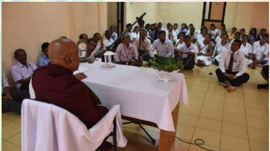
දිනය - 2018 මැයි මස 28 වන දින ප.ව. 12.30 සිට ප.ව 01.30 දක්වා

ධර්ම දේශනය මෙහෙයවීම - මාතර වල්ගම අනෝමරාමාධිපති, ශාස්ත්‍රවේදී, පණ්ඩිත පූජ්‍ය හක්මණ මදුරධම්ම ස්වාමීන්වහන්සේ විසින්