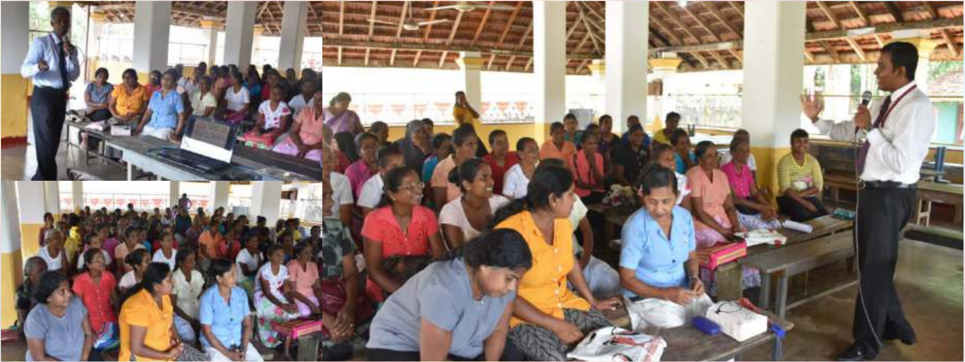
හික්කඩුව ප්‍රාදේශීය ලේකම් කාර්යාල බල ප්‍රදේශයේ වෙසෙන යූච් හා මධ්‍ය පරිමාණ ව්‍යවසායකයන් හා ග්‍රාමීය පුජාව සඳහා 2018 මැයි මස 03 වන දින හික්කඩුව ප්‍රාදේශීය ලේකම් කාර්යාලයේ ශ්‍රවණාගාරයේ දී පැවැත් වූ වැඩසටහන