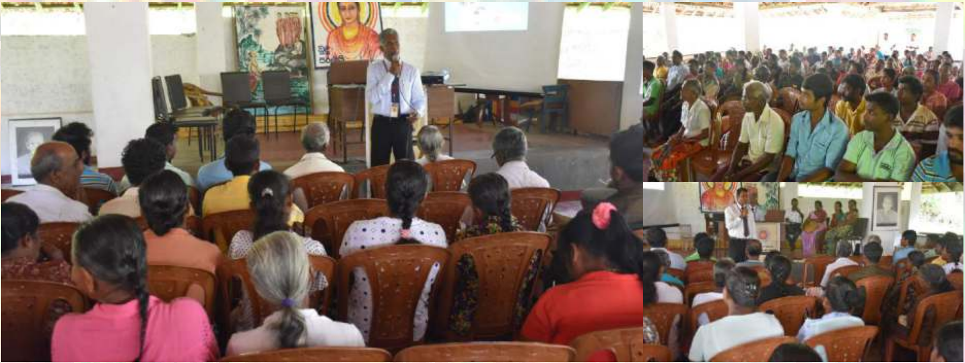
බෙන්තොට විරිස්වත්ත සමෘද්ධි පුජාව සඳහා 2018 අප්‍රේල් මස 04 වන දින බෙන්තොට අතුංගාගොඩ විජයාරාම විහාරස්ථානයේ දී පැවැත් වූ වැඩසටහන