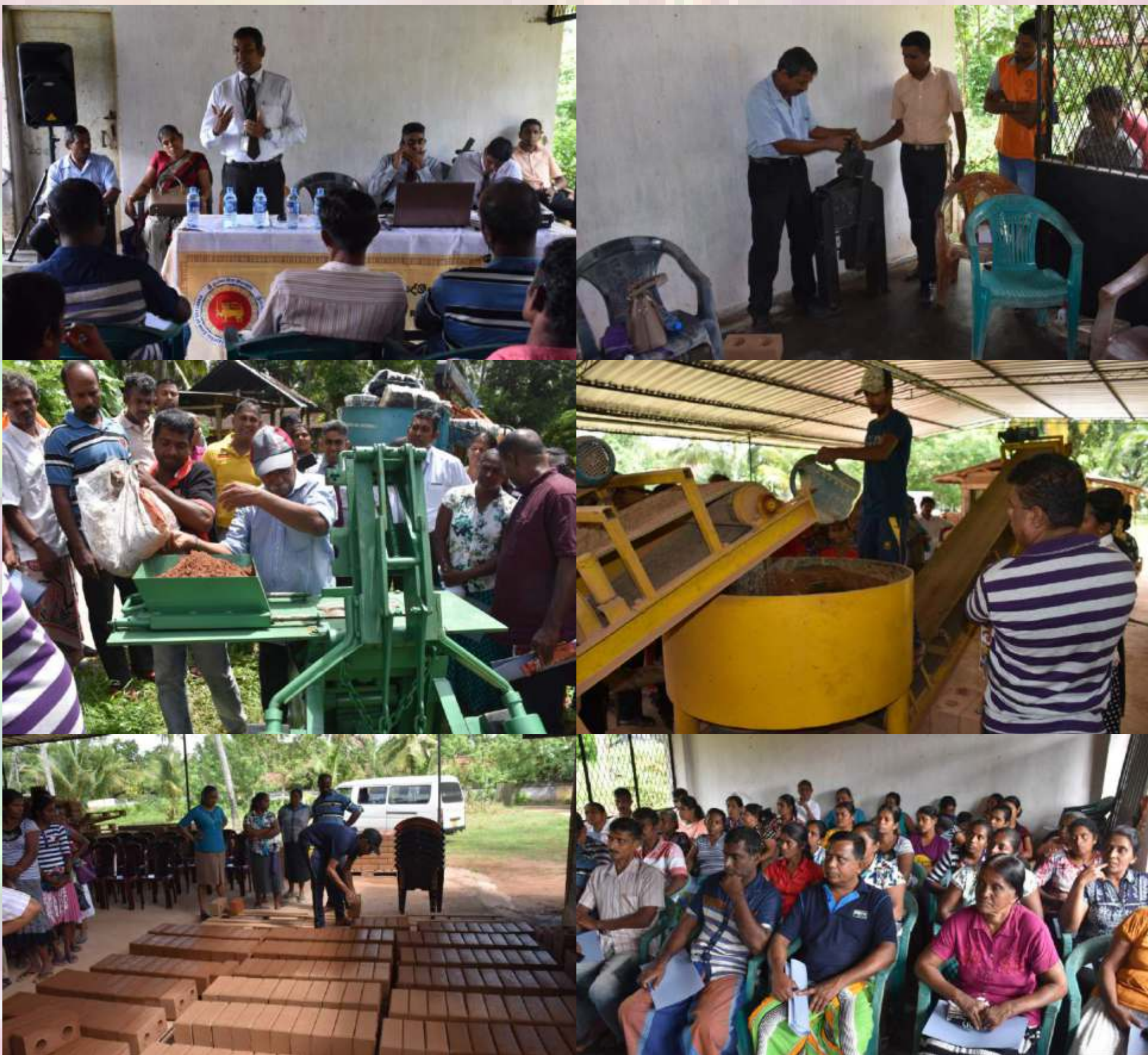
ශ්‍රී ලංකා මහ බැංකුව - ප්‍රාදේශීය කාර්යාලය - මාස 6

තව ද, ශ්‍රී ලංකා මහ බැංකුවේ මාතර ප්‍රාදේශීය කාර්යාලය විසින් මෙම වැඩසටහන සඳහා සහභාගී වූ ව්‍යවසායකයන් හට මහා පරිමාණයෙන් පරිසර හිතකාමී ගඩොල් නිෂ්පාදන කටයුතු සිදු කරන ආයතනයක ප්‍රායෝගික අත්දැකීම් ලබා දීමේ අරමුණින් පරිසර හිතකාමී ගඩොල් නිෂ්පාදනයේ මාතර දිස්ත්‍රික්කයේ ප්‍රමුඛයෙකු වන කිතුලෙවෙල තරුණ මධ්‍යස්ථානයේ ක්ෂේත්‍ර චාරිකාවක් ද එදින ම සංවිධානය කළ අතර ඒ මගින් ව්‍යවසායකයන්හට එම කර්මාන්තය ප්‍රායෝගිකව ක්‍රියාත්මක කරන ආකාරය පිළිබඳ නිවැරදි අවබෝධයක් ලබා ගැනීමට හැකි විය.