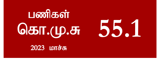
கொள்வனவு முகாமையாளர் சுட்டெண் - பணிகள்

பருவகால கேள்விக்கு இடமளிப்பதற்கான சில புதிய ஆட்சேப்புகளுக்கு மத்தியிலும் மாத காலப்பகுதியில் ஏற்பட்ட பதவிவிலகுதல்கள், புலம்பெயர்வுகள் மற்றும் ஓய்வுபெறுதல்கள் காரணமாக தொழில்நிலையானது மார்ச்சில் மெதுவான வேகத்தில் தொடர்ந்தும் வீழ்ச்சியடைந்தது. அதேவேளை, மாத காலப்பகுதியில் நிலுவையிலுள்ள பணிகளும் மெதுவான வேகத்தில் குறைவடைந்தன.