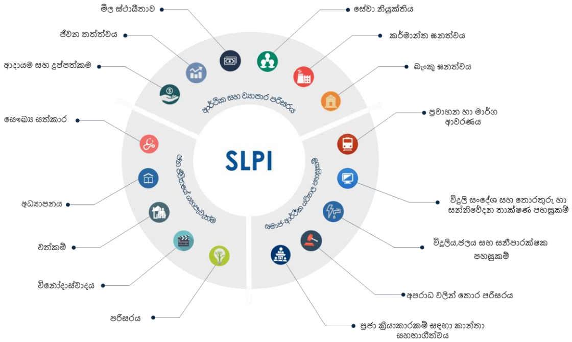
රූප සටහන 2 - සෞභාග්‍යතා දර්ශකය මගින් ආවරණය වන අංශ