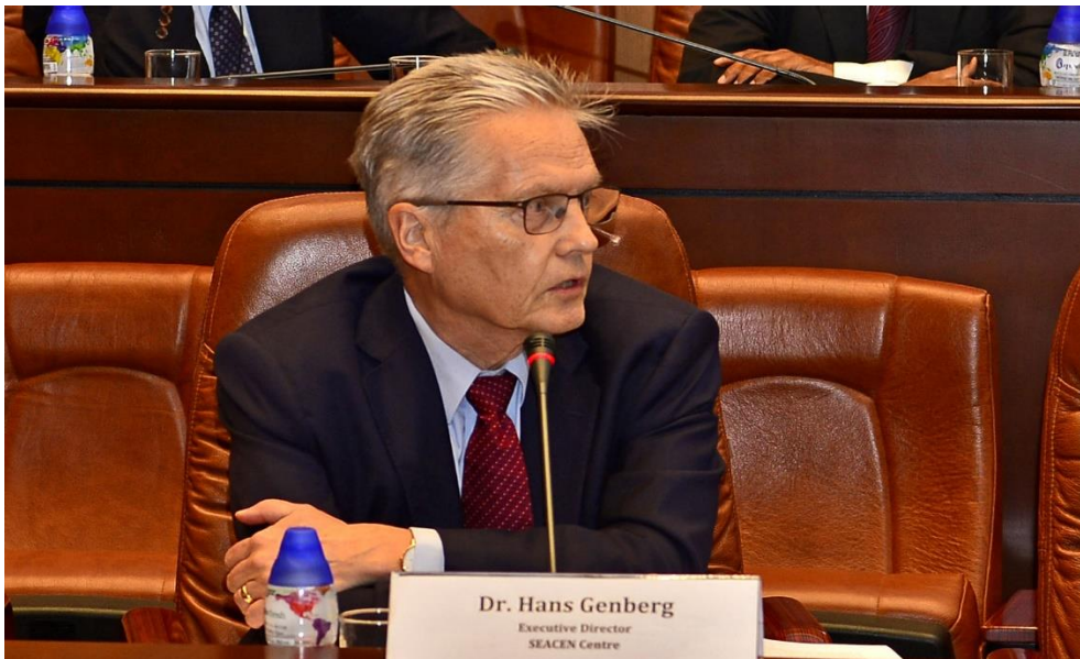
ආචාර්ය හාන්ස් ගෙන්බර්ග් මහතා ජාත්‍යන්තර පර්යේෂණ සමුළුව අමතමින්