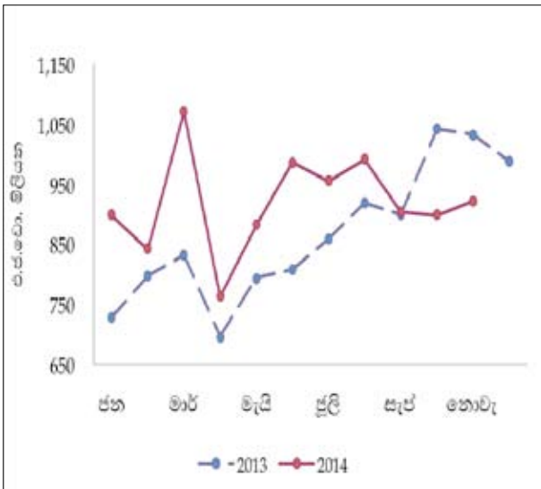
රූප සටහන 1: අපනයන සහ ආනයන ක්‍රියාකාරිත්වය

2014 නොවැම්බර් මාසයේ දී ආනයන වියදම පෙර වසරේ අනුරූප කාලපරිච්ඡේදයට සාපේක්ෂව එ.ජ.ඩොලර් මිලියන 1,645 ක් දක්වා සියයට 4.8 කින් වර්ධනය වූ අතර සමුච්චිත වශයෙන් සැලකූවිට 2014 පළමු මාස එකොළහේදී ආනයන වියදම එ.ජ.ඩොලර් මිලියන 17,618 ක් දක්වා සියයට 7.1 කින් වර්ධනය විය. 2014 නොවැම්බර් මාසයේ ආනයන වියදමෙහි වර්ධනය සඳහා මෝටර් සයිකල් සහ මෝටර් කාර් වැනි පෞද්ගලික වාහන මෙන්ම සහල් ආනයනයේ සැලකිය යුතු වර්ධනයක් සමග පාරිභෝගික භාණ්ඩ ආනයනයේ සිදු වූ වර්ධනය ප්‍රධාන වශයෙන් හේතු විය. 2014 නොවැම්බර් මාසයේ දී ඉන්ධන, තිරිඟු හා ඉරිඟු සහ ආහාර සැකසුම් ආනයන සැලකිය යුතු ලෙස අඩු වුවද අන්තර් භාණ්ඩ ආනයනය සුළු වශයෙන් වර්ධනය විය. රෙදිපිළි හා රෙදිපිළි උපාංග, පොහොර, රසායනික නිෂ්පාදිත, රබර් හා රබර් ආශ්‍රිත උපාංග සහ කඩදාසි හා ඝන කඩදාසි ආනයනය මෙම මාසය තුළ දී සැලකිය යුතු ලෙස වර්ධනය විය. මහ කන්නය සඳහා පොහොර විශාල ප්‍රමාණයක් ආනයනය කිරීම හේතුවෙන් 2014 නොවැම්බර් මාසයේ දී පොහොර ආනයනය සියයට 75.7 කින් වර්ධනය විය. මේ අතර, ඉන්ධන සඳහා වූ ආනයන වියදම සියයට 26.5 කින් අඩු වූ අතර, අඩු මිල ගණන් සහ අඩු පරිමාව හේතුවෙන් බොරතෙල් ආනයන වියදමේ සිදු වූ සැලකිය යුතු අඩු වීම මේ සඳහා හේතු විය. මේ අතර, සියලුම උප කාණ්ඩයන්ගේ ආනයනයන්හි අඩුවීම පිළිබිඹු කරමින් ආයෝජන භාණ්ඩ ආනයනය සියයට 10.4 කින් අඩු විය. 2014 පළමු මාස එකොළහ තුළ දී ප්‍රධානතම ආනයන ප්‍රභවයන් ලෙස තවදුරටත් ඉන්දියාව, චීනය, එක්සත් අරාබි එමීර් රාජ්‍යය, සිංගප්පූරුව සහ ජපානය පැවති අතර, එය මුළු ආනයනයන්ගෙන් සියයට 59 ක් පමණ විය.