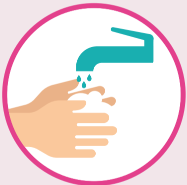
බැංකු පරිශ්‍රයට ඇතුළු වීමට පෙර ඔබේ දෑත් සොදුරු කර