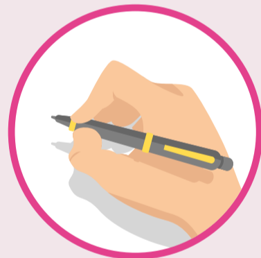
පොරම ආදී ලියකිවිලි පිරවීම සඳහා තමාගේම පෑනක් රැගෙන ඒමට අමතක නොකරන්න