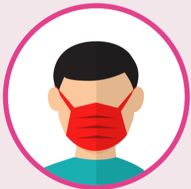
භියම්භ පරිදි මුහුණ ආවරණ පළඳින්න