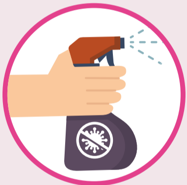
යම් මතුපිටක ස්පර්ශ කළ හැකි විශේෂ භාගක දියර යොදා ඔබේ දෑත් පිරිසුදු කරගන්න