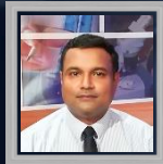
දේශක පිහිම් වතුගල මයා

අඟහරුවාදා (ජූලි 16) උදෑසන 5.00 සිට 6.00 දක්වා